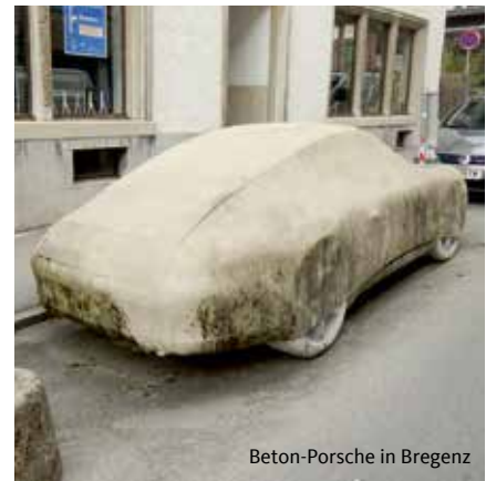
Beton-Porsche in Bregenz

stadt direkt vor dem Wunschziel abstellen zu können, nachhaltig anfängt zu bröckeln und der Einsicht weicht, dass der wertvolle öffentliche Raum lieber mit Leben zu füllen ist, als mit Stahl und Beton.