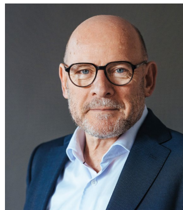
Winfried Hermann MdL Minister für Verkehr des Landes Baden-Württemberg